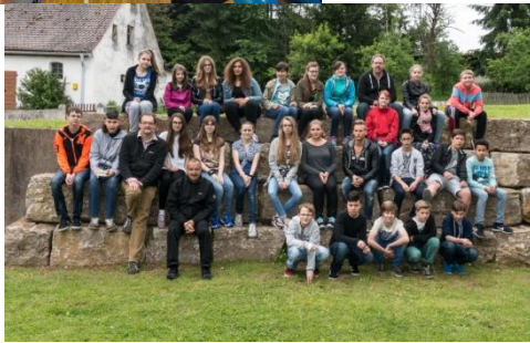
Auf einer Konfirmanden Freizeit