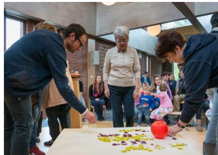
Neue Gottesdienstformen, wie Familiengottesdienste, gehören auch dazu.

Konfirmation: 10. April 2016 (Kirche St. Leonhard)