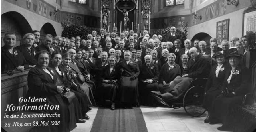
Die erste Goldene Konfirmation in St. Leonhard 1938

Die Jubilare, die vor 25, 50, 60 und mehr Jahren in einer unserer Kirchen konfirmiert wurden, sind herzlich eingeladen, sich im Haus der Kirche (Telefon: 23 99 19 0) zu melden.