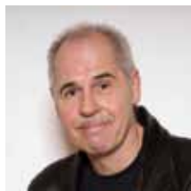
Gerhard Beck Architekt